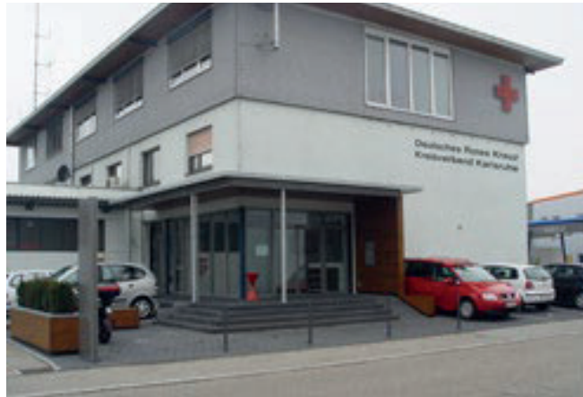
DRK-Kreisverband Karlsruhe, Simulations-, Trainings-, Ausbildungszentrum Bruchsal

Wachenleitung Krankentransport, Praxisanleiter, Hygienebeauftragter DRK-Kreisverband Karlsruhe e. V.